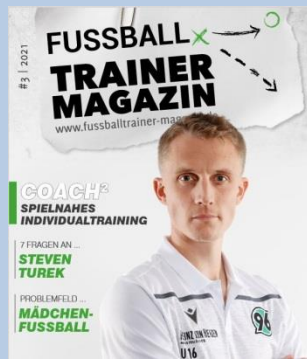
Ausgabe No. 3