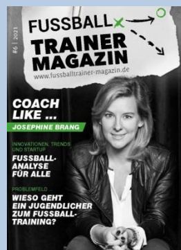
Ausgabe No. 6

Einfach die gewünschte Ausgabe anklicken und schon geht es los. Viel Spaß!