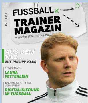
Ausgabe No. 4