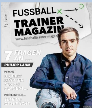
Ausgabe No. 5