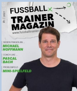
Ausgabe No. 1

Das Fussball-Trainer-Magazin begleitet euch auf eurem Weg als Trainer und bietet euch jede Hilfestellung, die ihr benötigt, um jeden Tag – jedes Training, besser zu werden.