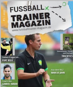
Ausgabe No. 7