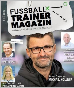
Ausgabe No. 1

Das Fussball-Trainer-Magazin begleitet euch auf eurem Weg als Trainer und bietet euch jede Hilfestellung, die ihr benötigt, um jeden Tag – jedes Training, besser zu werden.