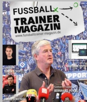
Ausgabe No. 8