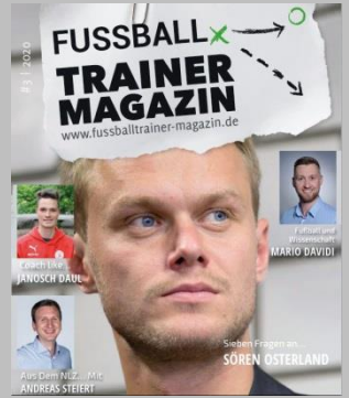
Ausgabe No. 3