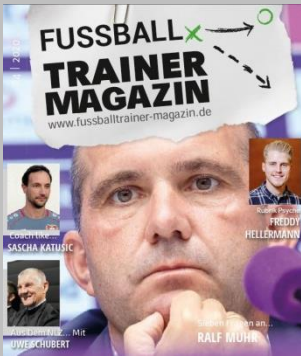
Ausgabe No. 4