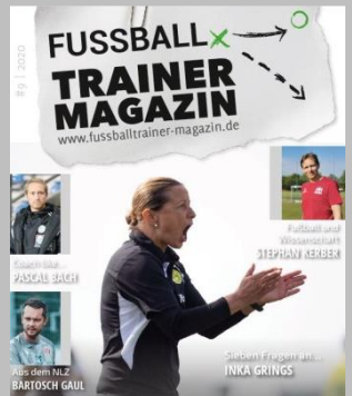
Ausgabe No. 9