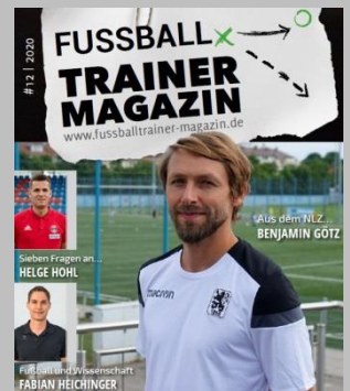
Ausgabe No. 12

Einfach die gewünschte Ausgabe anklicken und schon geht es los. Viel Spaß!