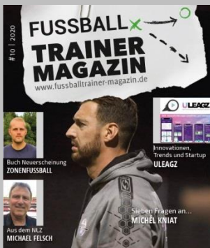
Ausgabe No. 10