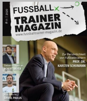
Ausgabe No. 11