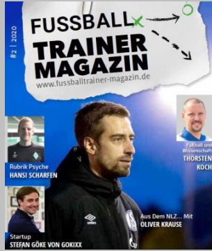
Ausgabe No. 2