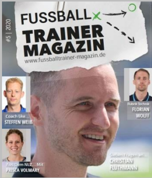
Ausgabe No. 5