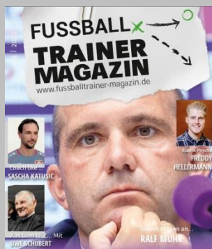
Ausgabe No. 4