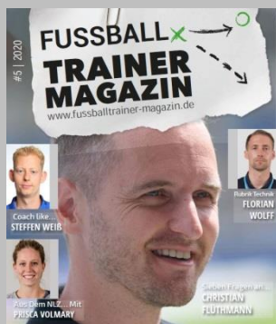
Ausgabe No. 5