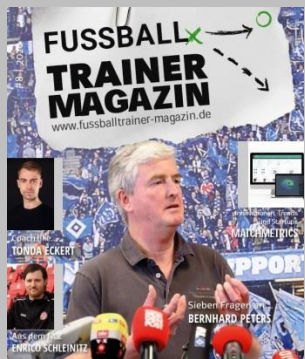
Ausgabe No. 8