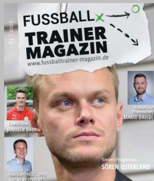
Ausgabe No. 3