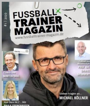
Ausgabe No. 1

Das Fussballtrainer Magazin begleitet euch auf eurem Weg als Trainer und bietet euch jede Hilfestellung, die ihr benötigt, um jeden Tag – jedes Training, besser zu werden.