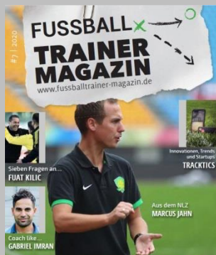
Ausgabe No. 7