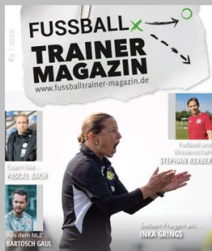
Ausgabe No. 9

Einfach die gewünschte Ausgabe anklicken und schon geht es los. Viel Spaß!