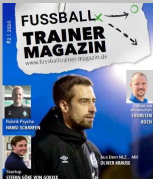
Ausgabe No. 2